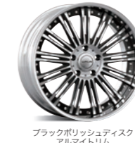
ブラックポリッシュディスク アルマイトリム