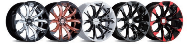
シルバーブラック