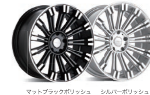
マットブラックポリッシュ