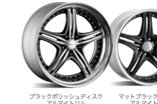
ブラックポリッシュディスク アルマイトリム