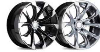
ブラックポリッシュ