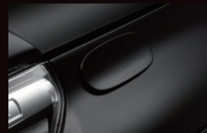
アシストミラーカバー