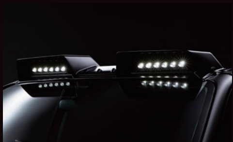
05. フロントルーフスポイラー