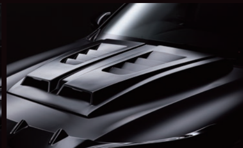
07. ボンネットスクープカバー