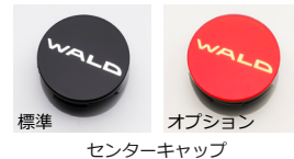
標準 オプション センターキャップ